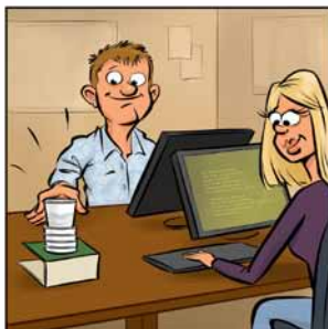
Verzamel ze in de bekerhouder (zonder roerstokje)