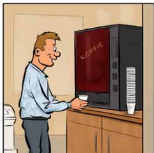
Gebruik uw bekertje een aantal keer