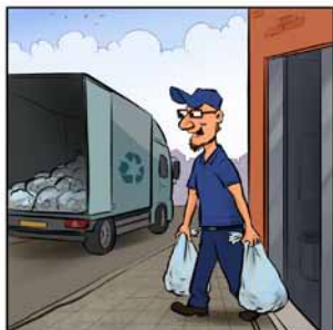
Bepaal zelf de ophaalfrequentie