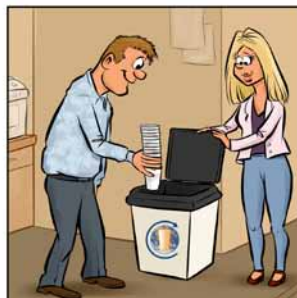
Stapeltje? Deponeer ze in de inzamelbak