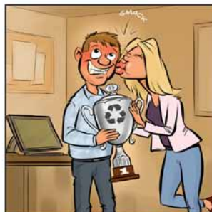
Duurzaam de beste!

Sinds 1991 is Stichting Disposables Benelux (SDB) actief in de inzameling en recycling van (kunststof) drinkbekers die gebruikt worden in drankautomaten. Oorspronkelijk was de stichting een initiatief van de beker-, koffie- en drankautomatenleveranciers. Inmiddels hebben vele andere organisaties de stichting omarmd. De doelstelling is sinds 1991 ongewijzigd gebleven: door inzameling en recycling van kunststof drinkbekers wil SDB een bijdrage leveren aan het hergebruik van kunststoffen. De Stichting heeft geen winstoogmerk.