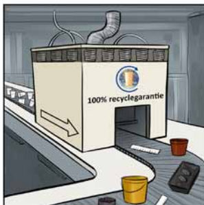
Uw afval verandert in nieuwe producten